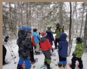
スノーシューをはいて 冬の森を探検!