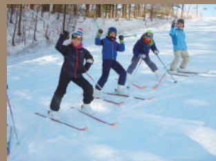
初めての子も、慣れている子も 自分のペースで楽しく滑ろう!