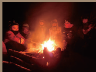
まっくらな雪の森の中で キャンプファイヤー