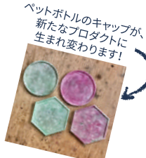
ペットボトルのキャップが、新たなプロダクトに生まれ変わります!

子供が生まれた事、海が大好きだった事、これがSwell Plastic誕生のきっかけです。『1人のちよっとは無駄じゃない』この言葉を信念とし、プラスチック問題について活動しています。